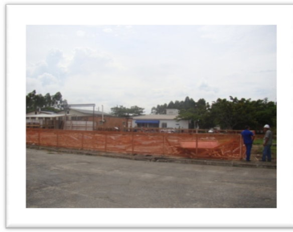
O recomeço: início das construções do prédio dos novos laboratórios didáticos da EEL (2011)