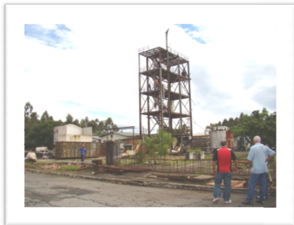
Momentos finais da usina (2010)