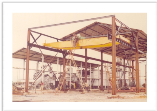
Sistema de moagem de cana de açúcar da usina de álcool. Capacidade de produção: 5 mil litros.