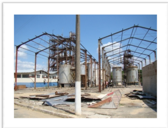
Tanques de fermentação das usinas sendo desmontados