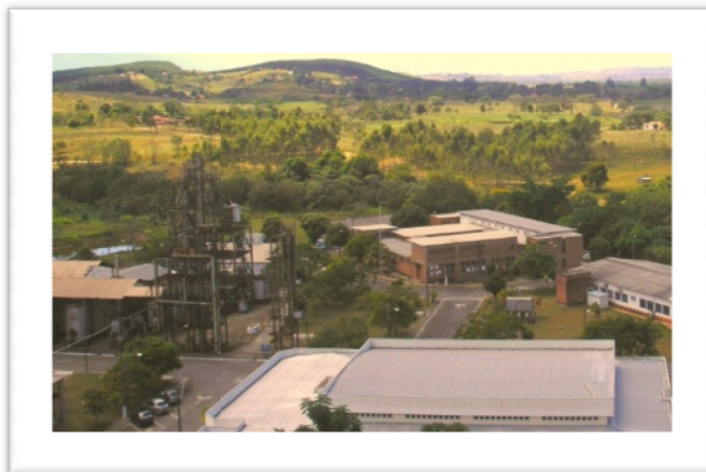
Vista panorâmica da usina. Ao fundo o prédio do Departamento de Biotecologia. (2005)