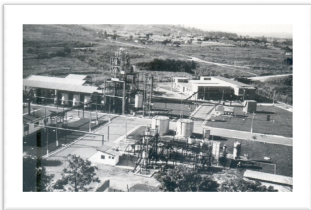
Vista panorâmica da usina. Ao fundo o prédio do Departamento de Biotecnologia. (1980)