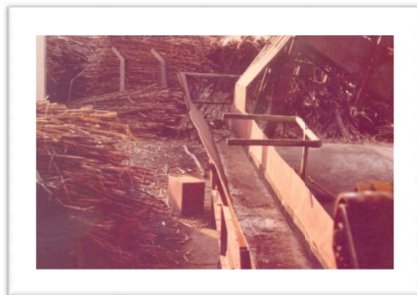
Detalhe da moagem de cana