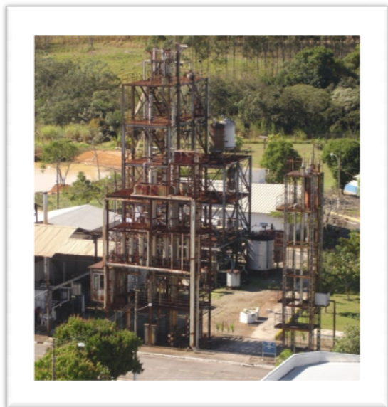
Usina de álcool e evaporador de múltiplo efeito