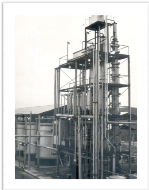
Destilaria: Capacidade de produção: 5 mil litros